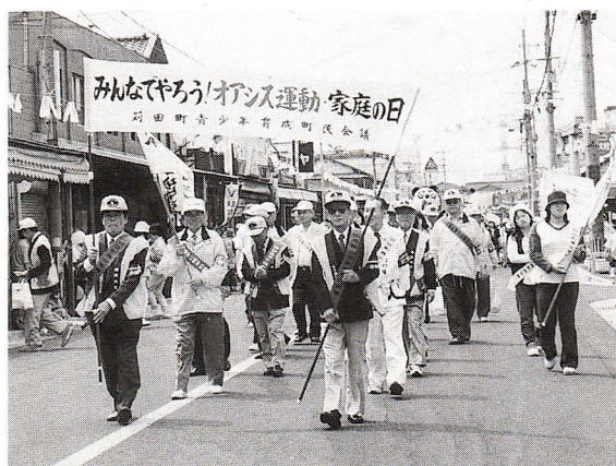
▲今年の港まつりパレードより