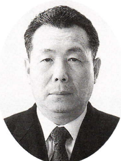
前町田町青少年育成町民会議会長