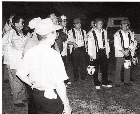
▶夜間街頭補導のようす