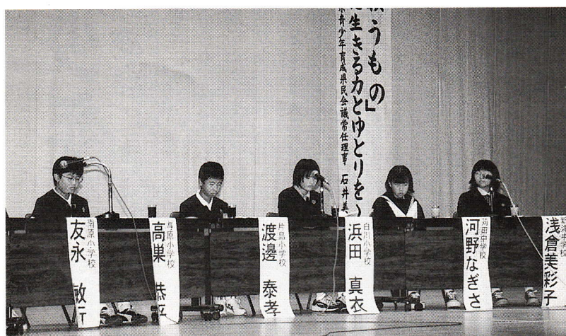
▲▶ 昨年の家庭シンポジウムより