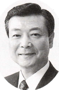
町田町青少年育成町民会議会長