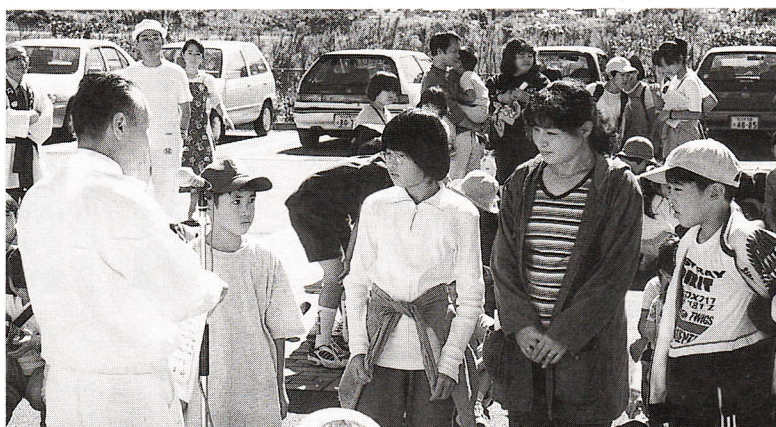
▲昨年のウォークラリー大会より