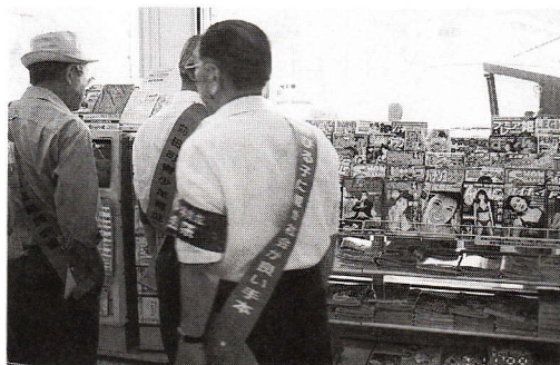
▲昨年の有害図書追放書店訪問より

シンナー等薬物乱用防止、少年のたまり場等の実態把握並びに地域での啓発活動の推進を図っています。