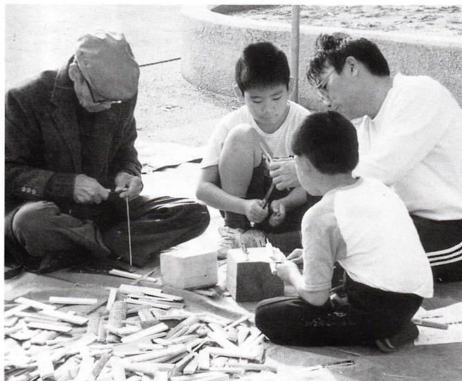
▲ 3世代で竹トンボづくり