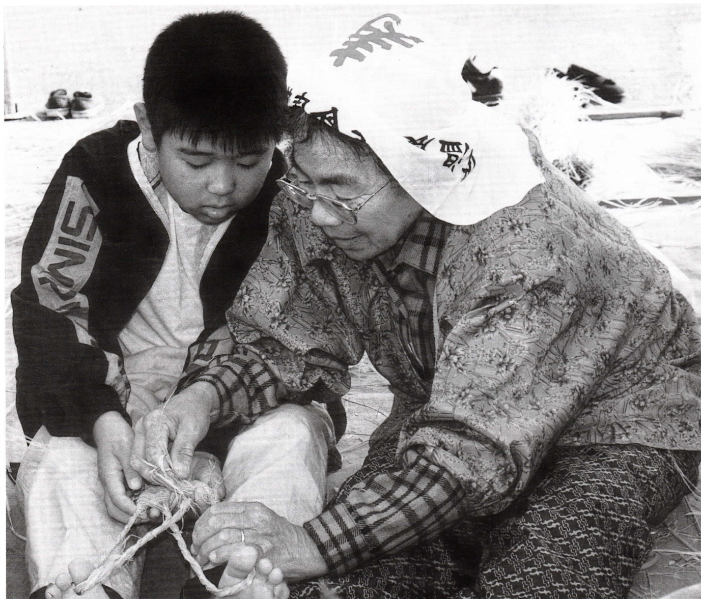
▼伝承工芸での「わらじ」「びんこ」