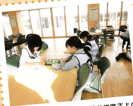
冬は暖かいランクルームで静かに遊びよ！