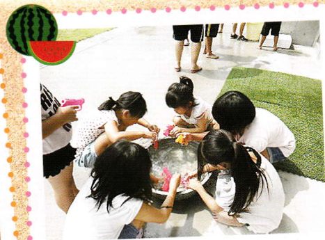
夏はみんなで水遊び〜♪