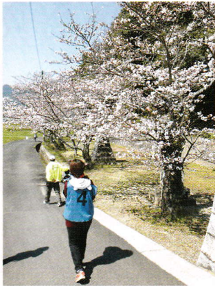
春は満開の桜の下を散歩！