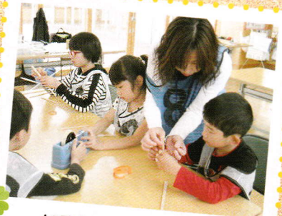
いろんな工作にも挑戦！